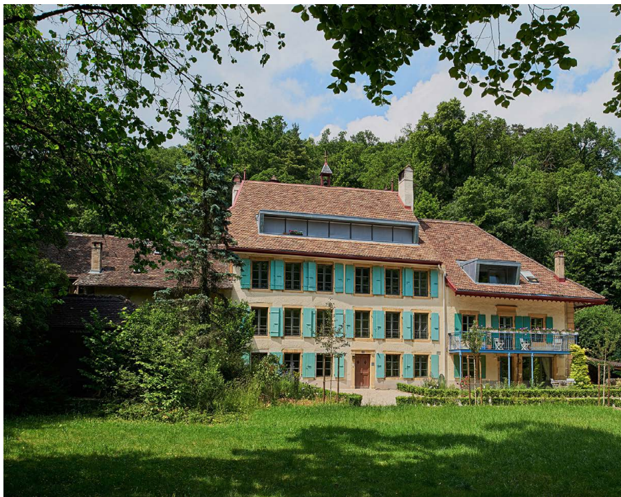
Le Pertuis est divisé en trois parties. Un loft moderne a été créé dans les combles de la partie centrale.